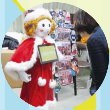
(福)秀明会 特別養護老人ホーム あすーる吹田で活躍するベッパーくん

ケータイショップや一般のお店でもよく見かけるようになったロボット「ベッパー」くん。そんなベッパーくんが、いま介護業界で、活躍しています。施設の利用者さんといっしょにダンスをしたり、年齢当てクイズを楽しんだり。季節の行事に合わせたコスチュームで施設の人気者になっています。福祉の現場では声かけは、とても大切なコミュニケーションです。利用している方の生活をサポートするさまざまなプログラムが次々と開発されています。