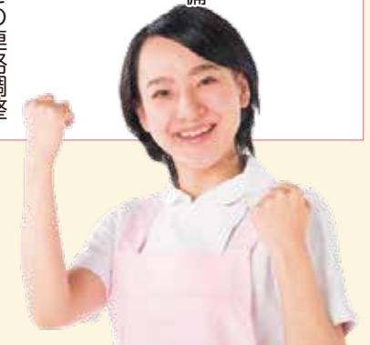
ホームヘルパーの場合