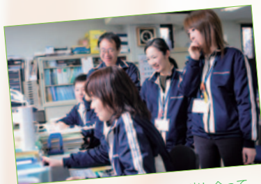
たくさんの意見やアイデアを出し合って改善策を導き出します

援センターに就職しましたが、その後震災をきっかけに、ふるさとで働きたいという思いが強くなり、再就職したのが南相馬市社会福祉協議会です。現在は、認知症や知的障がいなどにより、日常生活上の判断に不安がある方の相談に応じて、必要な福祉サービスにつなげる仕事をしています。