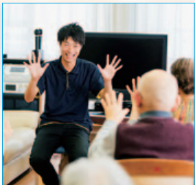
笑顔が絶えない介護の職場

介護職は、AIにはできない。いっしょに笑ったり、手をつないだり、人間だからこそできる仕事。なんだと思います。