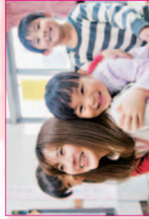
大好きな先生と一緒に！ クラスに元気な声が響き渡ります

保育士は子どもの見本となる仕事です。子どもと関わるのが好きで、将来保育士になりたいという方は、まずは大きな声であいさつをするところから始めてみてください。