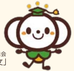
文京区社会福祉協議会 キャラクター「きく文」