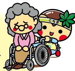
とちまるくん ©栃木県