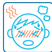
発熱・だるさのある方