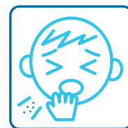
咳・息苦しさのある方