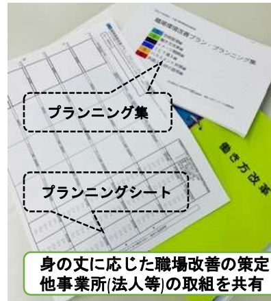
身の丈に応じた職場改善の策定 他事業所(法人等)の取組を共有